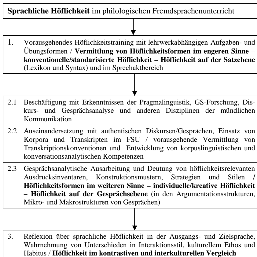
Abb. 2: Vorschlag einer Höflichkeitsdidaktik in der philologischen Sprachausbildung (PIEKLARZ 2011, 2011a).

Die folgende Abbildung ist als Vorschlag einer philologischen Höflichkeitsdidaktik zu betrachten.